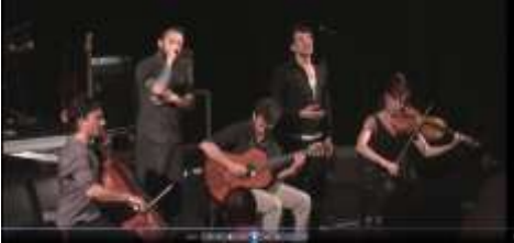
CABADZI